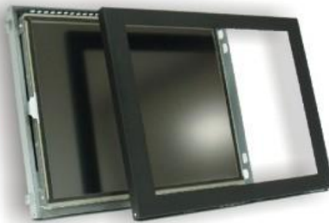
Versión sin Marco