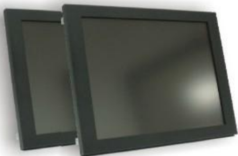
Versión con Marco